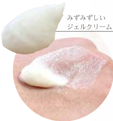
みずみずしい ジェルクリーム

お肌にすっと みずみずしくなじみます。 なじんだ後はベタつかず サラサラの仕上がりです。